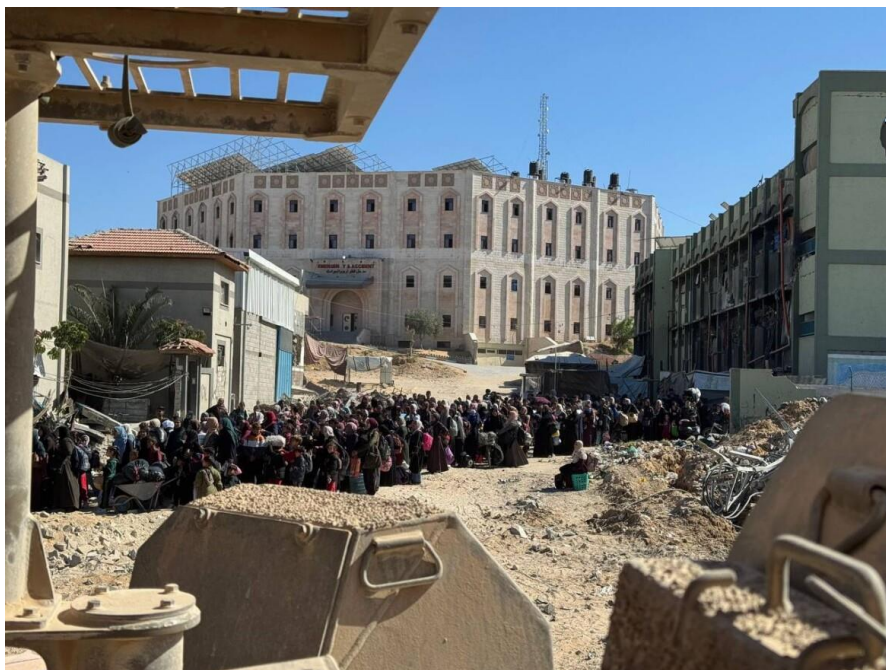
La cacciata delle donne, divise dagli uomini, a Jabaliya in una foto pubblicata dall'esercito israeliano il 20 ottobre 2024

Israele, ovviamente, considera ogni casa e ogni vicolo di Gaza una potenziale minaccia e un obiettivo legittimo. E quale sarà la scusa per negare l'ingresso a Gaza a sei gruppi di assistenza medica che lavorano con l'Organizzazione mondiale della Sanità? Molto probabilmente si tratta di una punizione per aver inviato nella Striscia medici occidentali che in seguito hanno pubblicato testimonianze sui cecchini israeliani che prendevano di mira i bambini. Un rapporto delle Nazioni unite pubblicato in precedenza ha concluso che Israele sta portando avanti «una politica concertata per distruggere il sistema sanitario di Gaza» come parte del «crimine contro l'umanità dello sterminio».