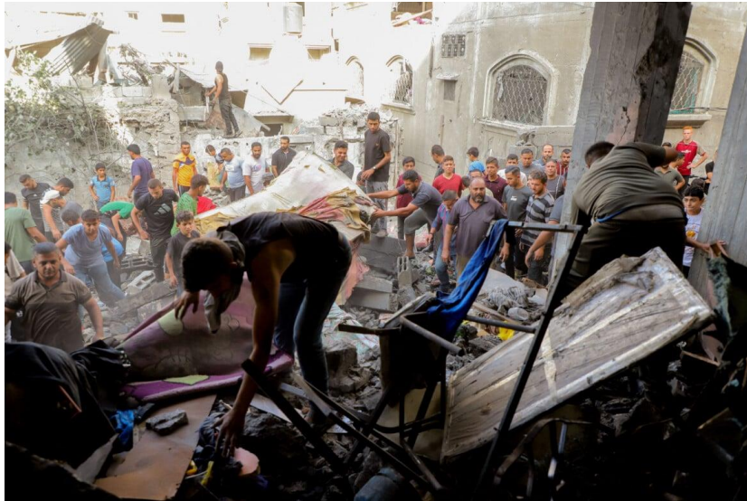
Alla ricerca di superstiti tra le macerie della casa della famiglia Abdullah a Jabaliya

aiutarlo, viene improvvisamente colpita da un altro attacco aereo, che uccide una persona e ne ferisce più di 20. Questa è la realtà in cui si trova il popolo di Israele. Questa è la realtà in cui la gente del nord di Gaza avrebbe dovuto camminare, affamata ed esausta, verso la «zona umanitaria».