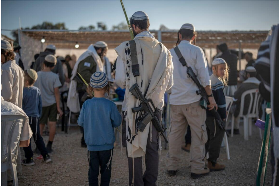
21 ottobre 2024, la conferenza per la «ricolonizzazione» di Gaza